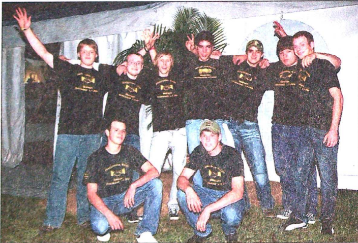
„Gleich geht's los“, nämlich die Feiern zum Jubiläum der „Eintracht Breidscheid 1908 e.V

„Soviel Braten und Schinken, wie gegenwärtige Tische tragen können“ und „soviel Wein von dem Besten, bis sie nicht mehr stehen können“ sind womöglich ideale Voraussetzungen für ein vergnügliches Vereinsleben und eine gedeihliche Zukunft, wenn man den guten Wünschen eines alten Hilichspruchs vertrauen möchte. Ein und ein Sechstel Dutzend Mitglieder sind heutzutage im Verein aufgelistet, diese ver-